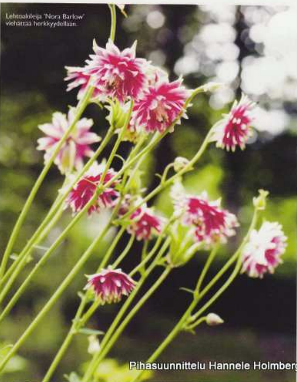
Lehtoakileija 'Nora Barlow' viehättää herkkyydellään.

Hannele ei ole kuitenkaan heittänyt toivoaan, vaan hakee koko ajan uusia, ihania lajeja. Tavalliset kasvit saavat puutarhassa antaa tilaa erikoisille ja harvinaisille kasveille. ♣