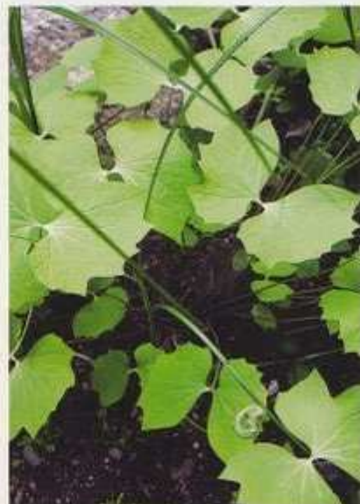
Lehtojalava 'Jacqueline Hillier' on hieno pensas.

Näkkeihin kuuluvalla lajilla Jeffersonia diphylla on kauniit perhosenmuotoiset lehdet. Sen valkoiset kukat aukeavat keväällä.