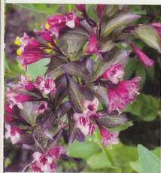
Tummalehtinen komeakotakuusama häikäydyttää.