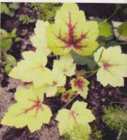
Haltiankukka 'Stoplight' näkyy kaus.