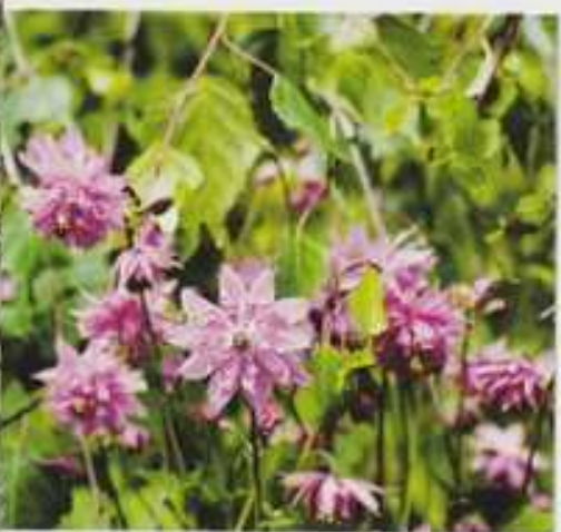
Lehtoakileija ja kyynelkoivu ovat soma pari.