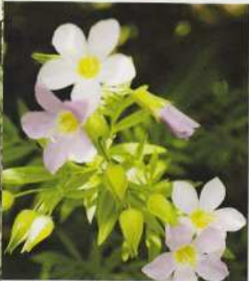
Sinilatvojen sukuun kuuluva kaunotar.