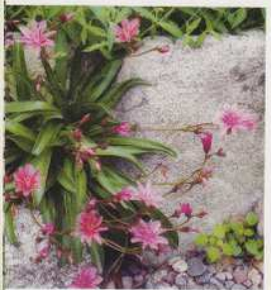
Kesälevisiä 'Little Plum' viihtyy kivenkolossa.