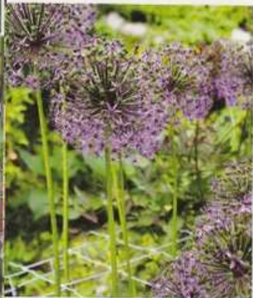
Jättitaukko ei jää huomaamatta.