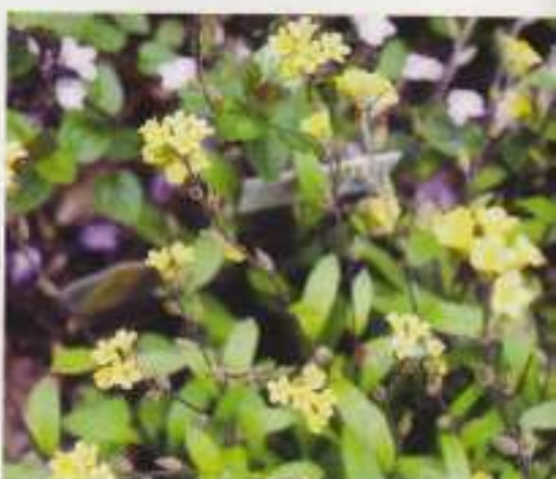
Keltakukkainen lemmikki on ihana erikoisuus.