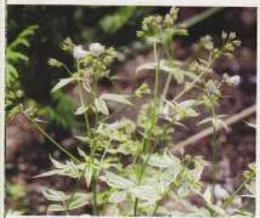
Niittysinilätvä 'Stairway to Heaven' on kirjava.