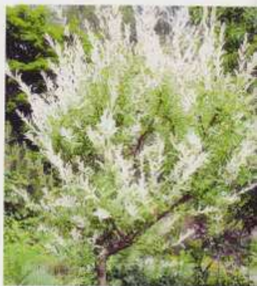
Hakuropajulla on vaaleat versojen kärjet.